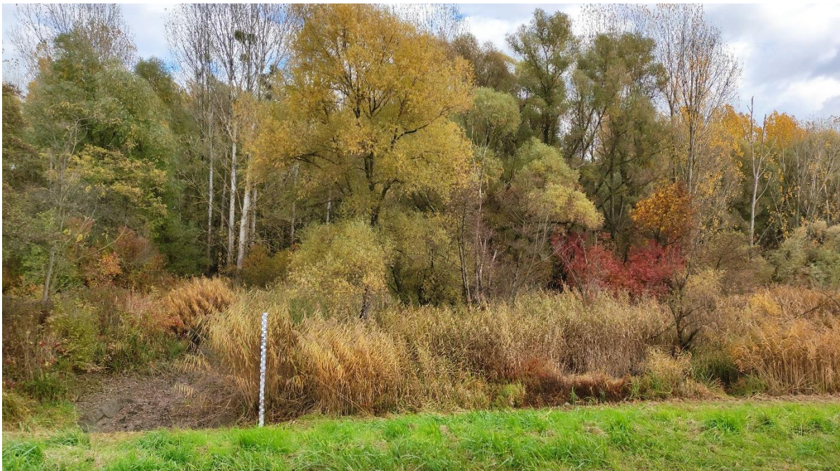
1. kép – Natura 2000-es elegyes erdőállomány a hullámtéren

a Magyar Állam tulajdonában és az ÉDUVIZIG vagyonkezelésében álló védett, ill. Natura 2000-es hálózat részét képező ingatlanokon, hogy részben költségvetési keretből saját kapacitással, részben pedig közmunkaprogram keretében, foglalkoztatási céllal közmunkások bevonásával elvégezhesse a fentiekben részletezett feladatokat.